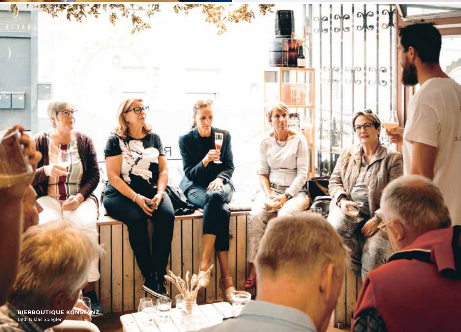
BIERBOUTIQUE KONSTANZ