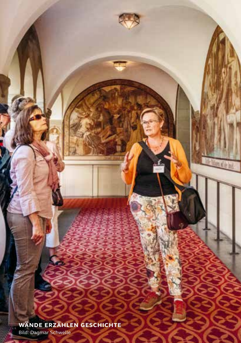
WÄNDE ERZÄHLEN GESCHICHTE