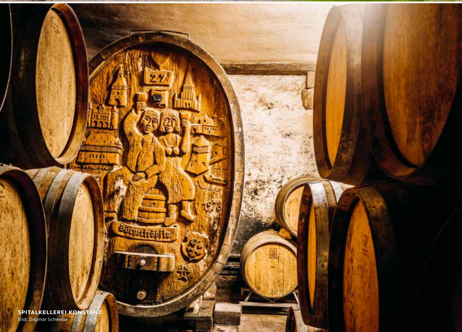
SPITALKELLEREI KONSTANZ