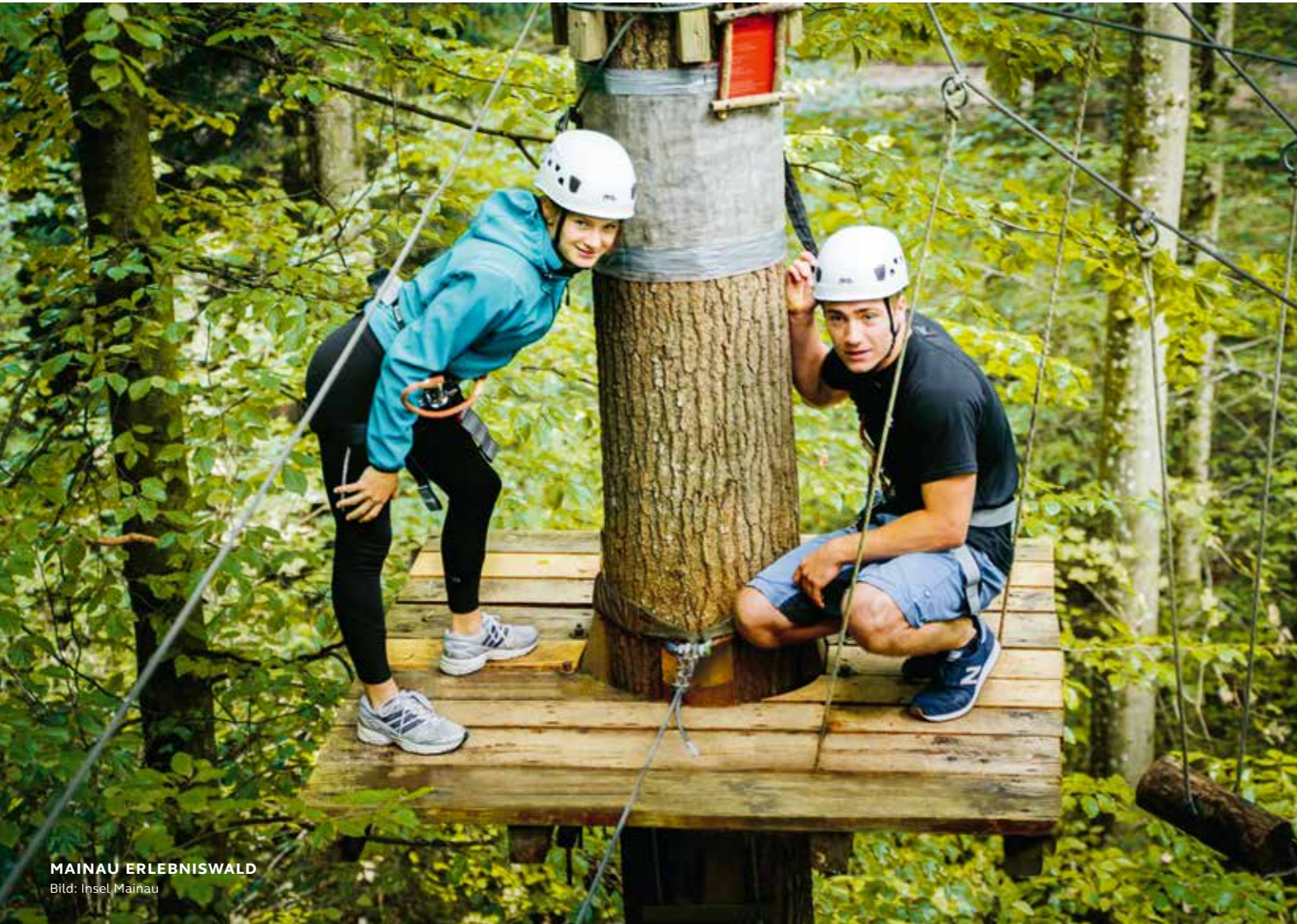
MAINAU ERLEBNISWALD