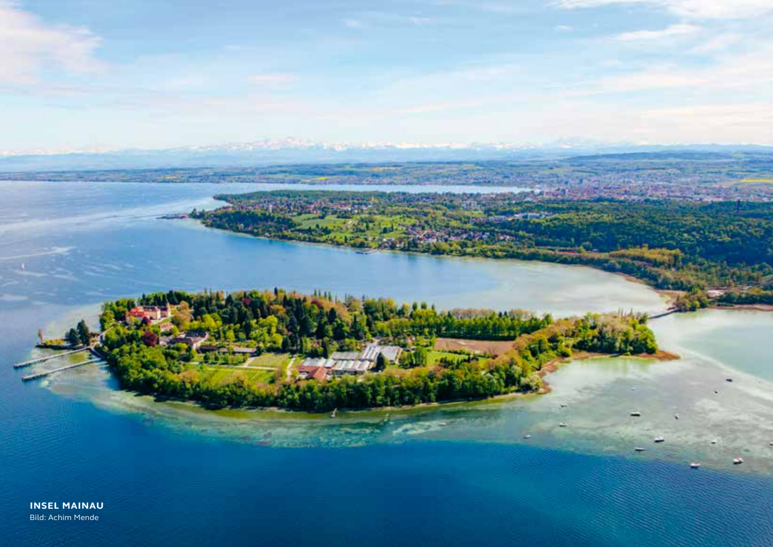
INSEL MAINAU