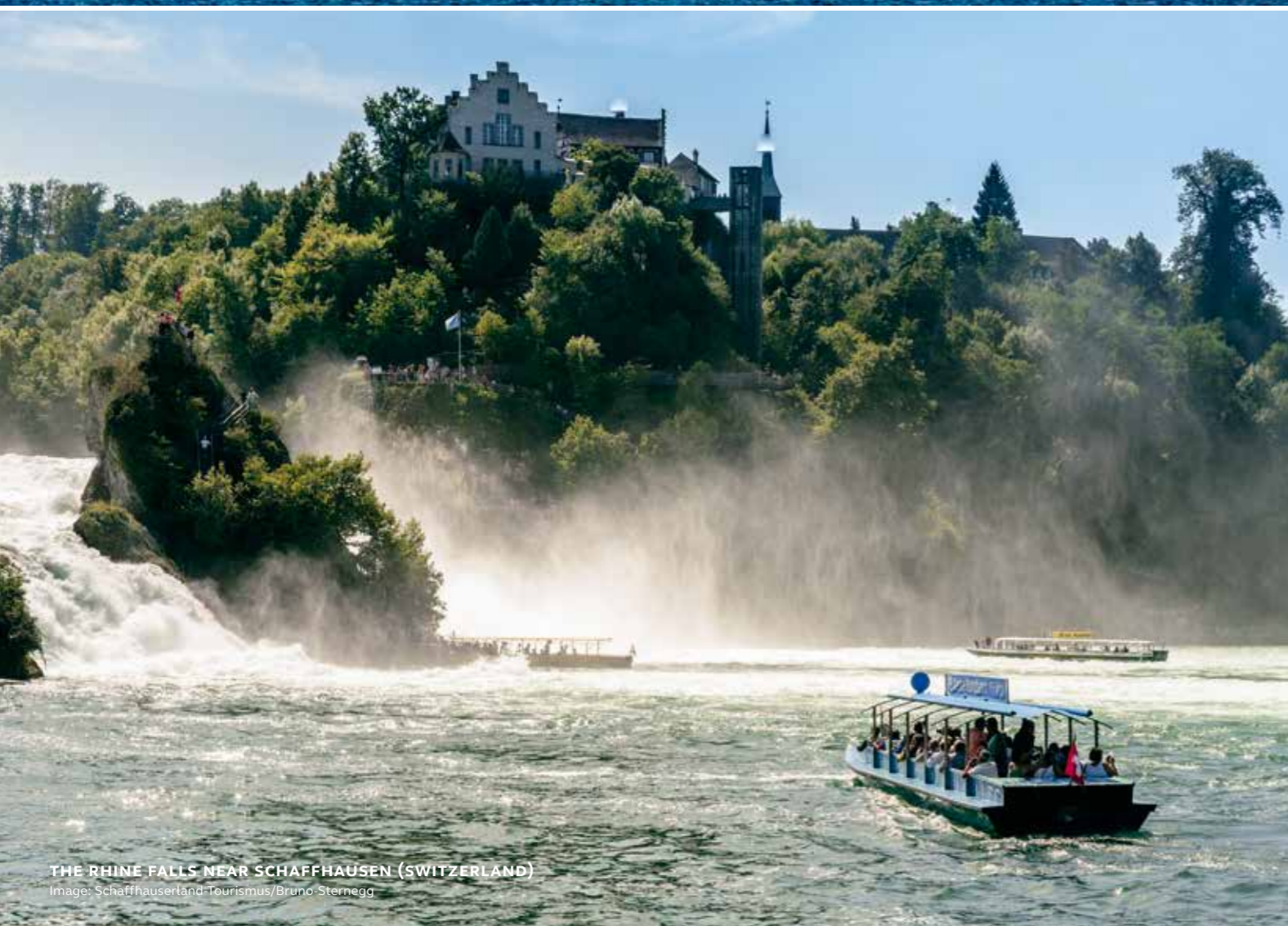
THE RHINE FALLS NEAR SCHAFFHAUSEN (SWITZERLAND)

This tour can be combined with a tour of Meersburg or a tour of Constance.