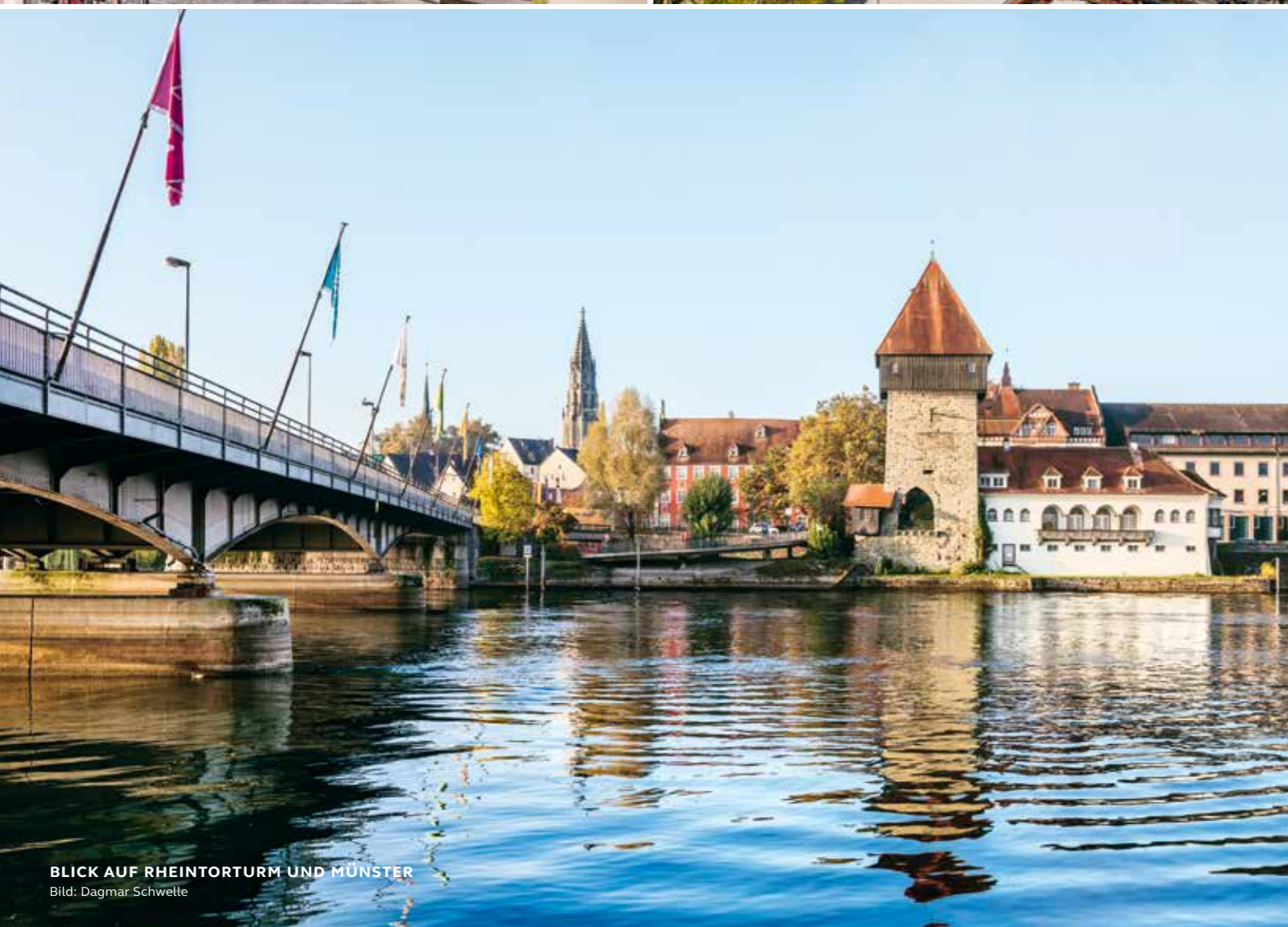
BLICK AUF RHEINTORTURM UND MÜNSTER