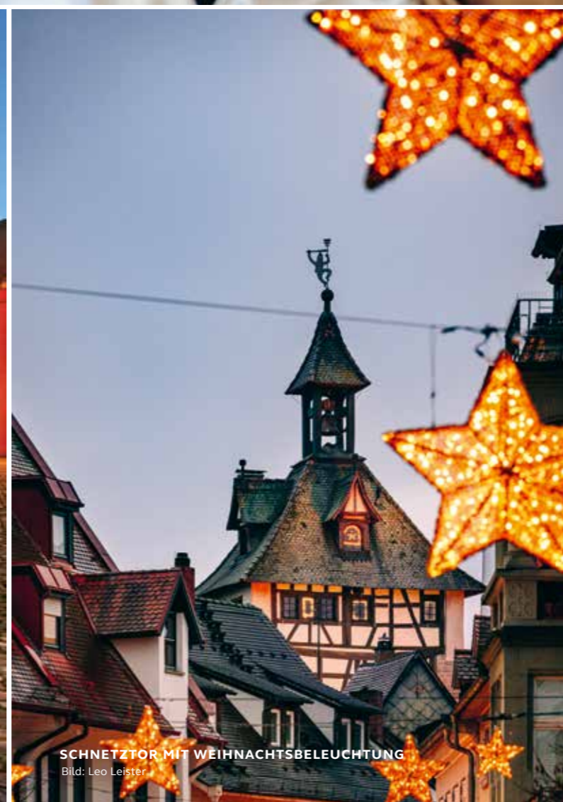
SCHNETZTOR MIT WEIHNACHTSBELEUCHTUNG