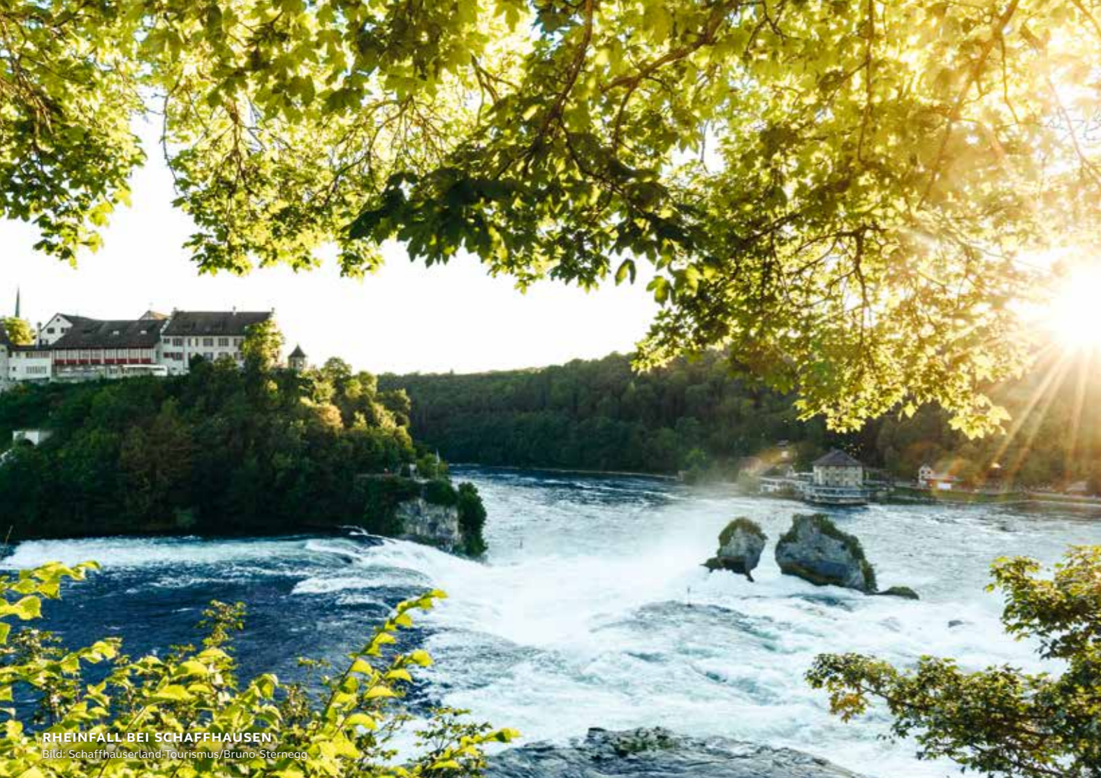
RHEINFALL BEI SCHAFFHAUSEN