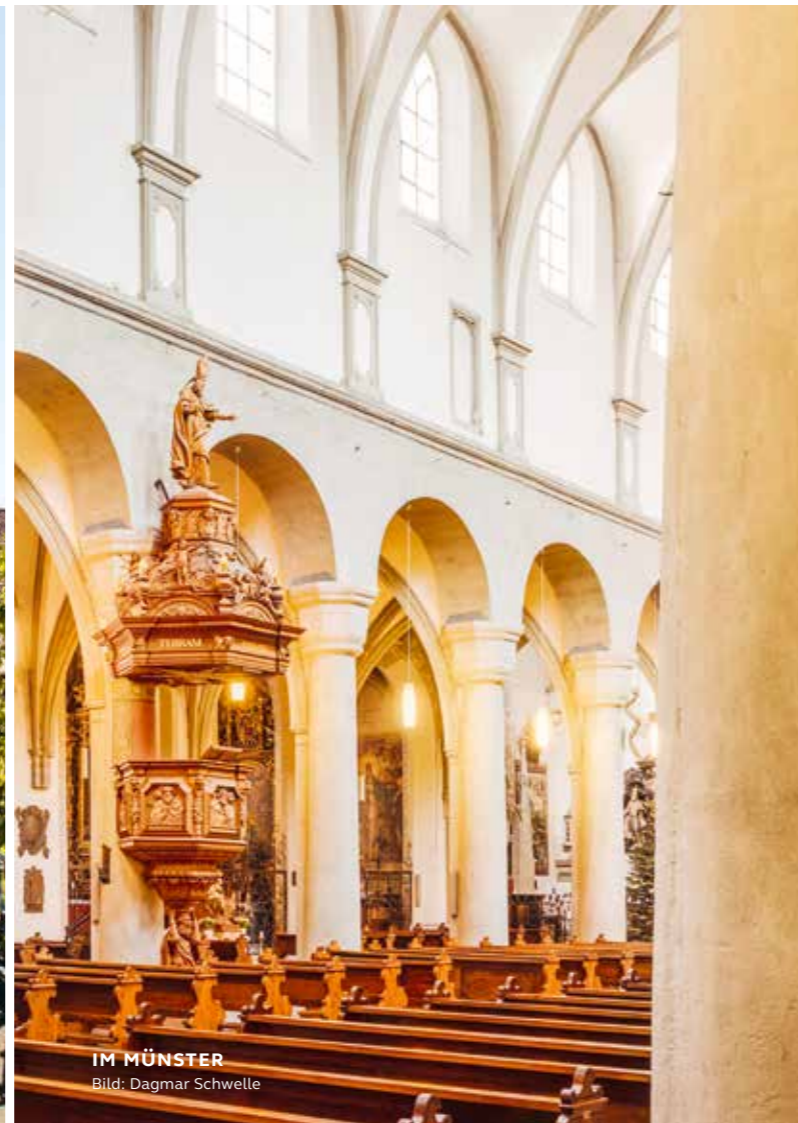
IM MÜNSTER