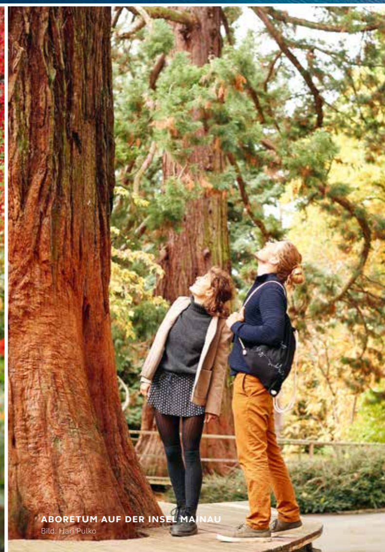
ABORETUM AUF DER INSEL MAINAU