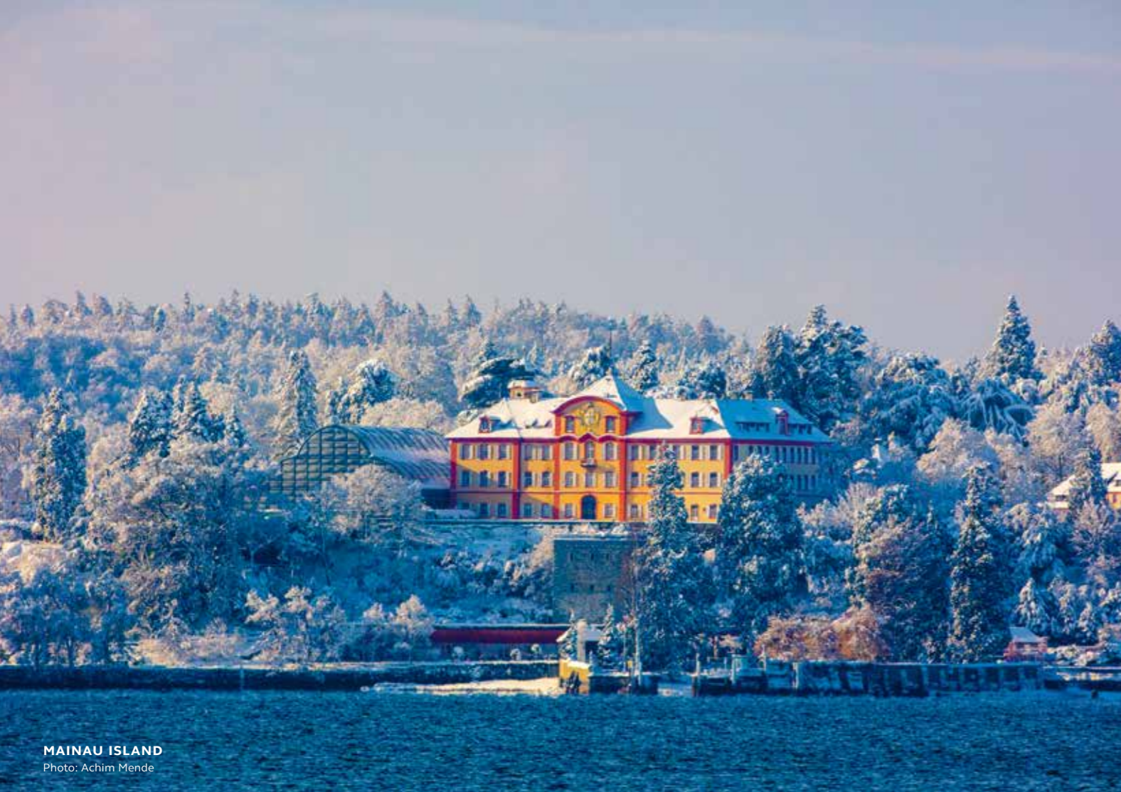
MAINAU ISLAND