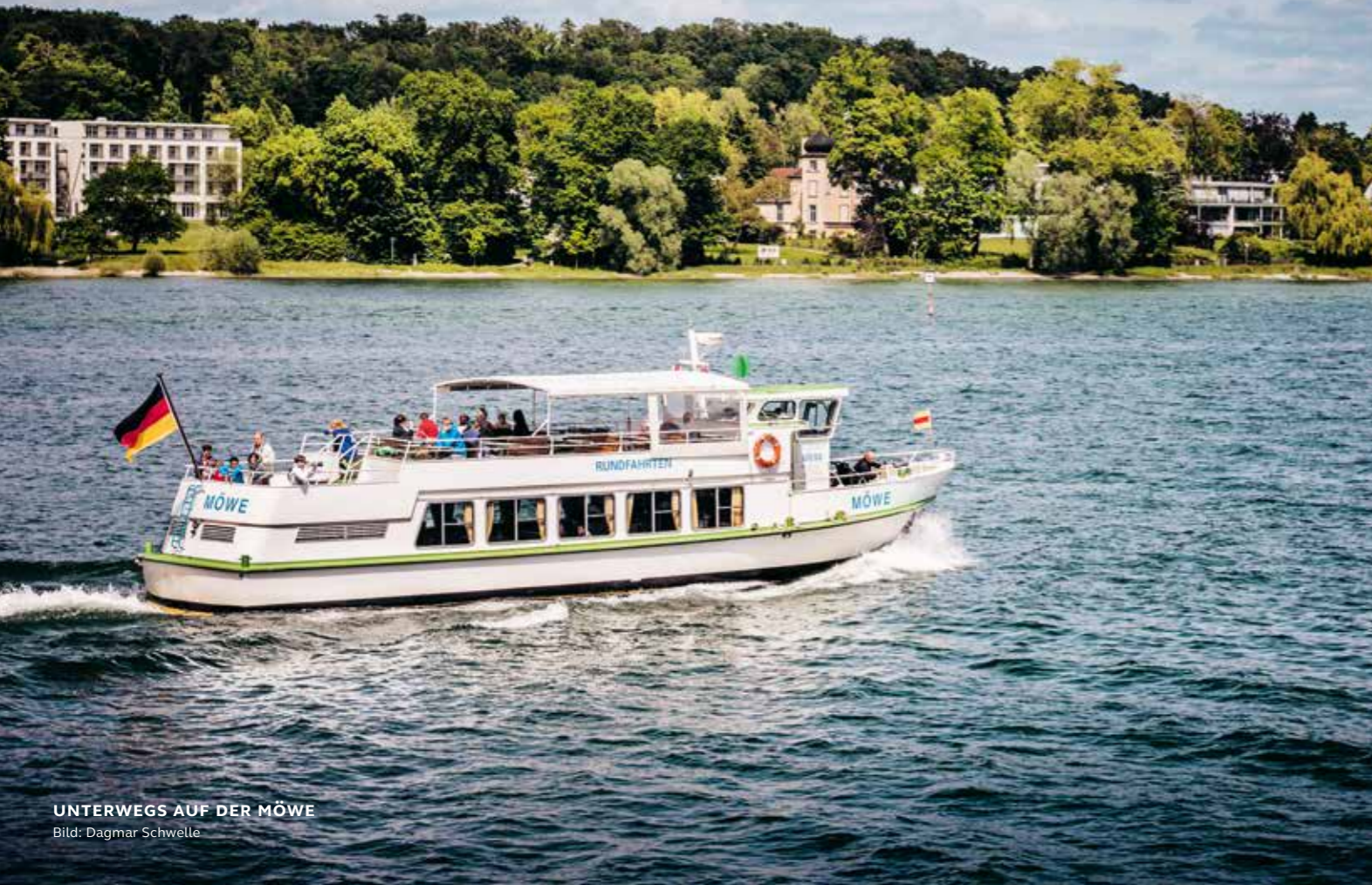
UNTERWEGS AUF DER MÖWE