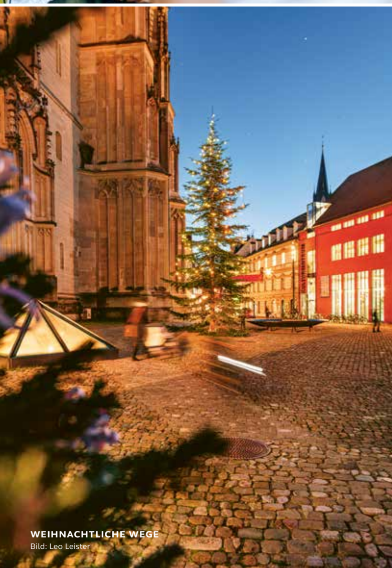
WEIHNACHTLICHE WEGE