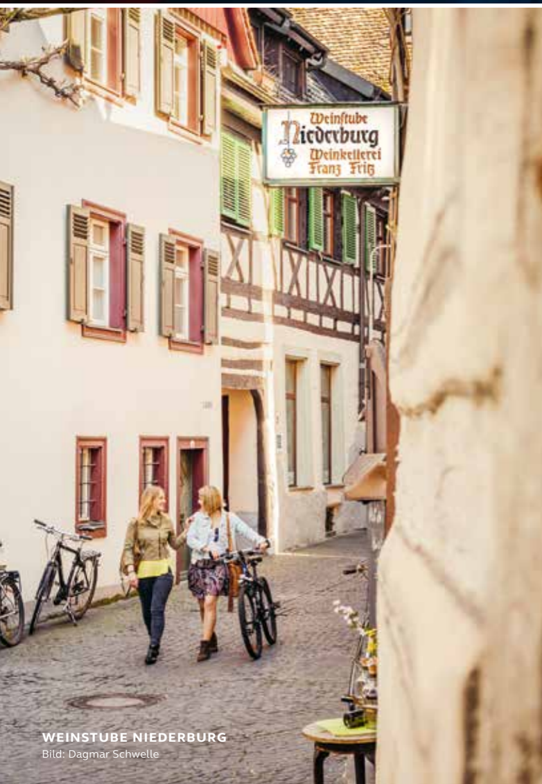
WEINSTUBE NIEDERBURG