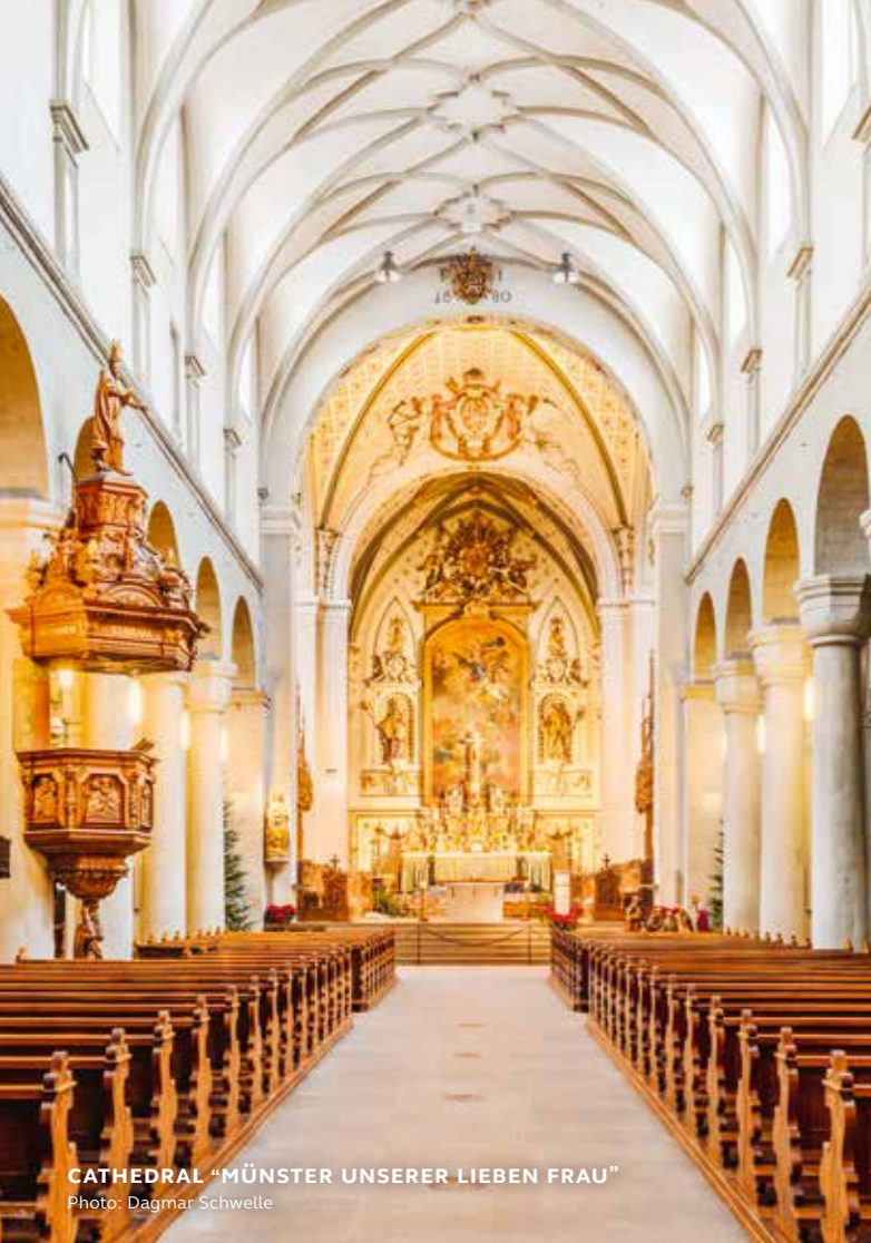
CATHEDRAL "MÜNSTER UNSERER LIEBEN FRAU"