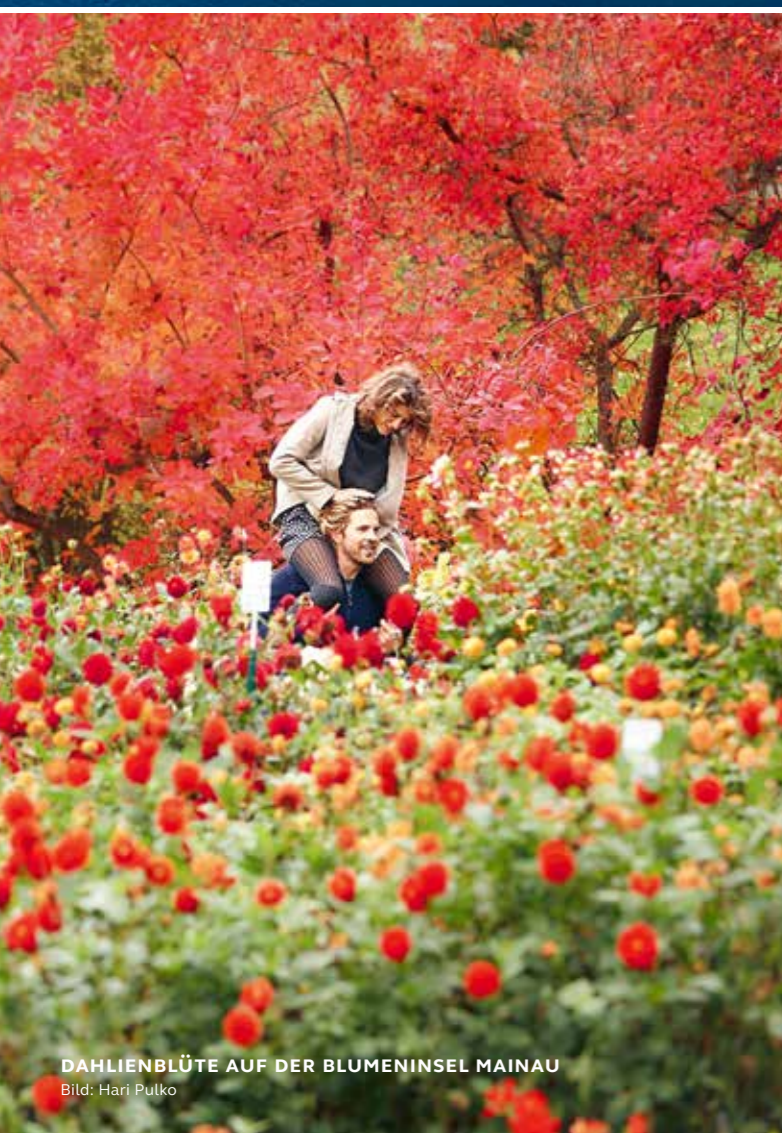
DAHLIENBLÜTE AUF DER BLUMENINSEL MAINAU