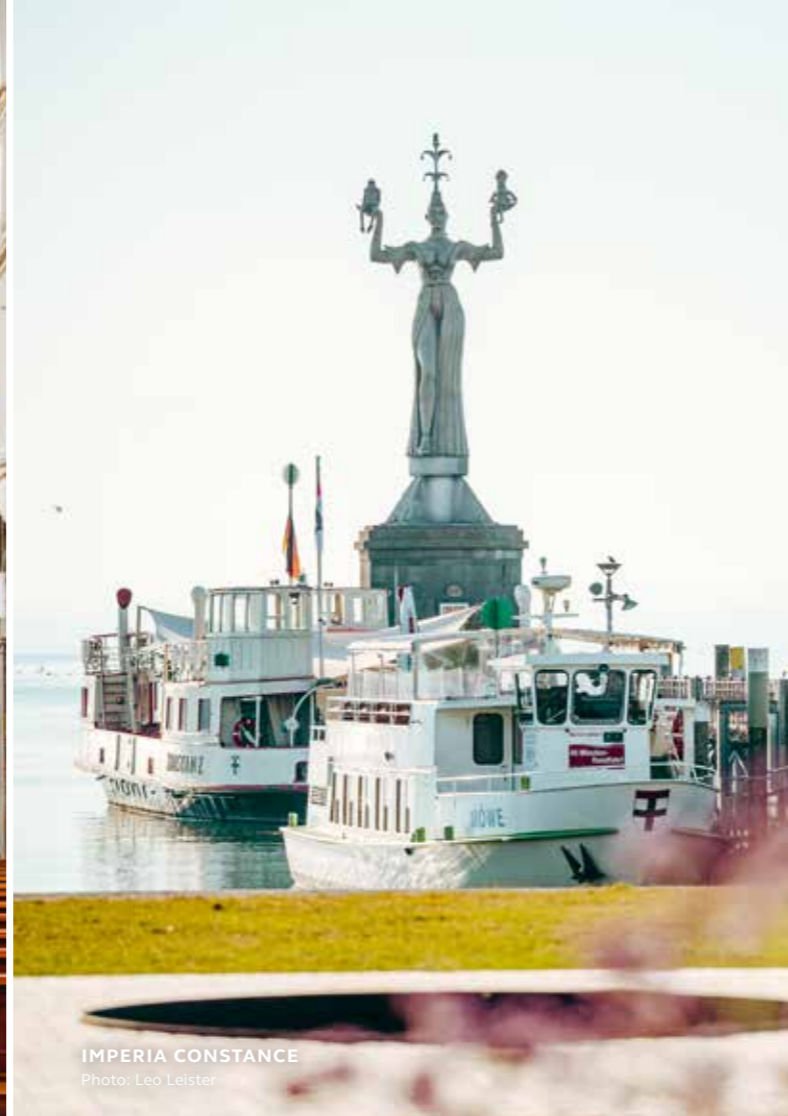
IMPERIA CONSTANCE