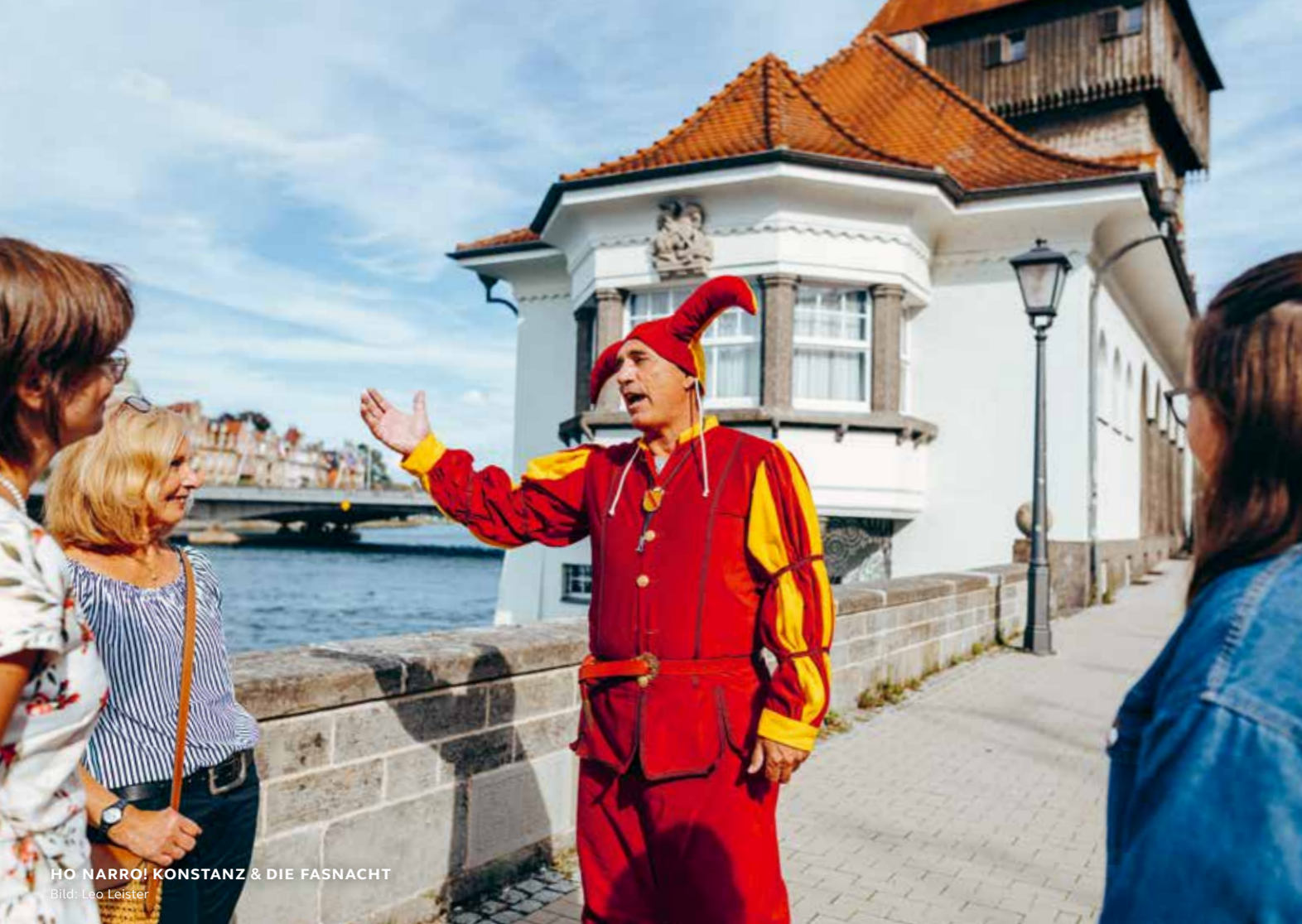
HO NARRO! KONSTANZ & DIE FASNACHT