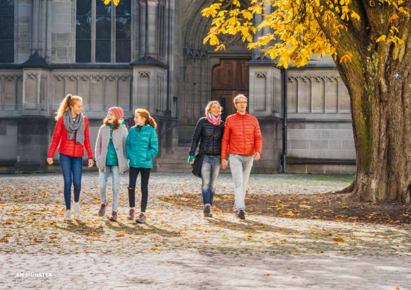
AM MÜNSTER