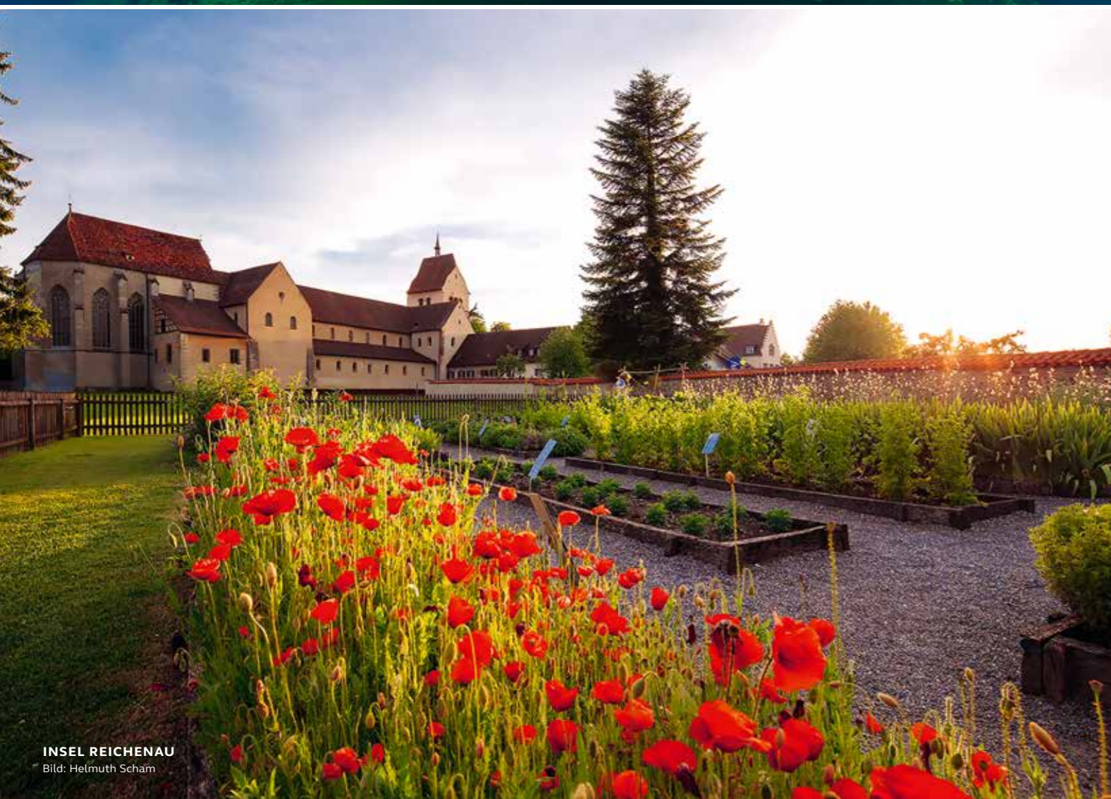
INSEL REICHENAU