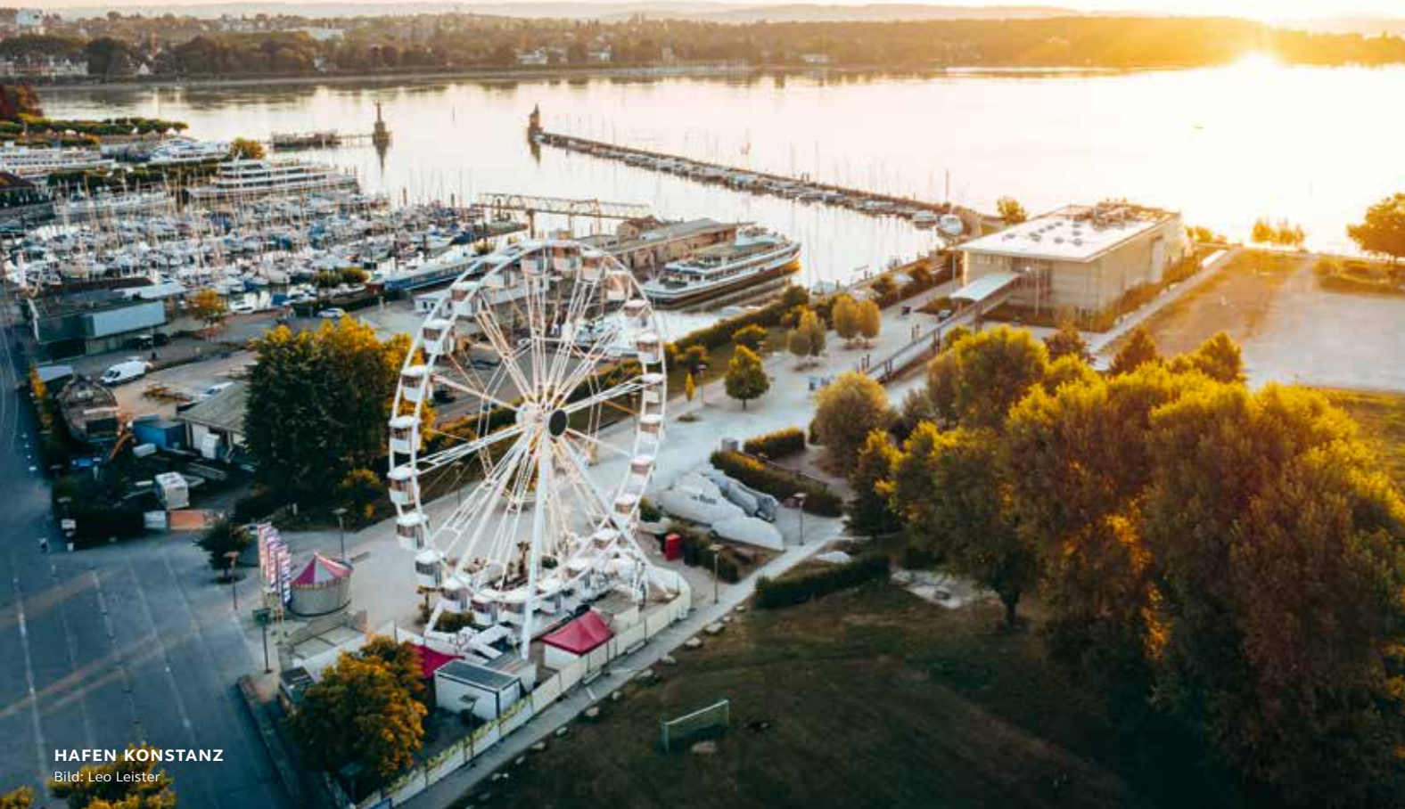
HAFEN KONSTANZ