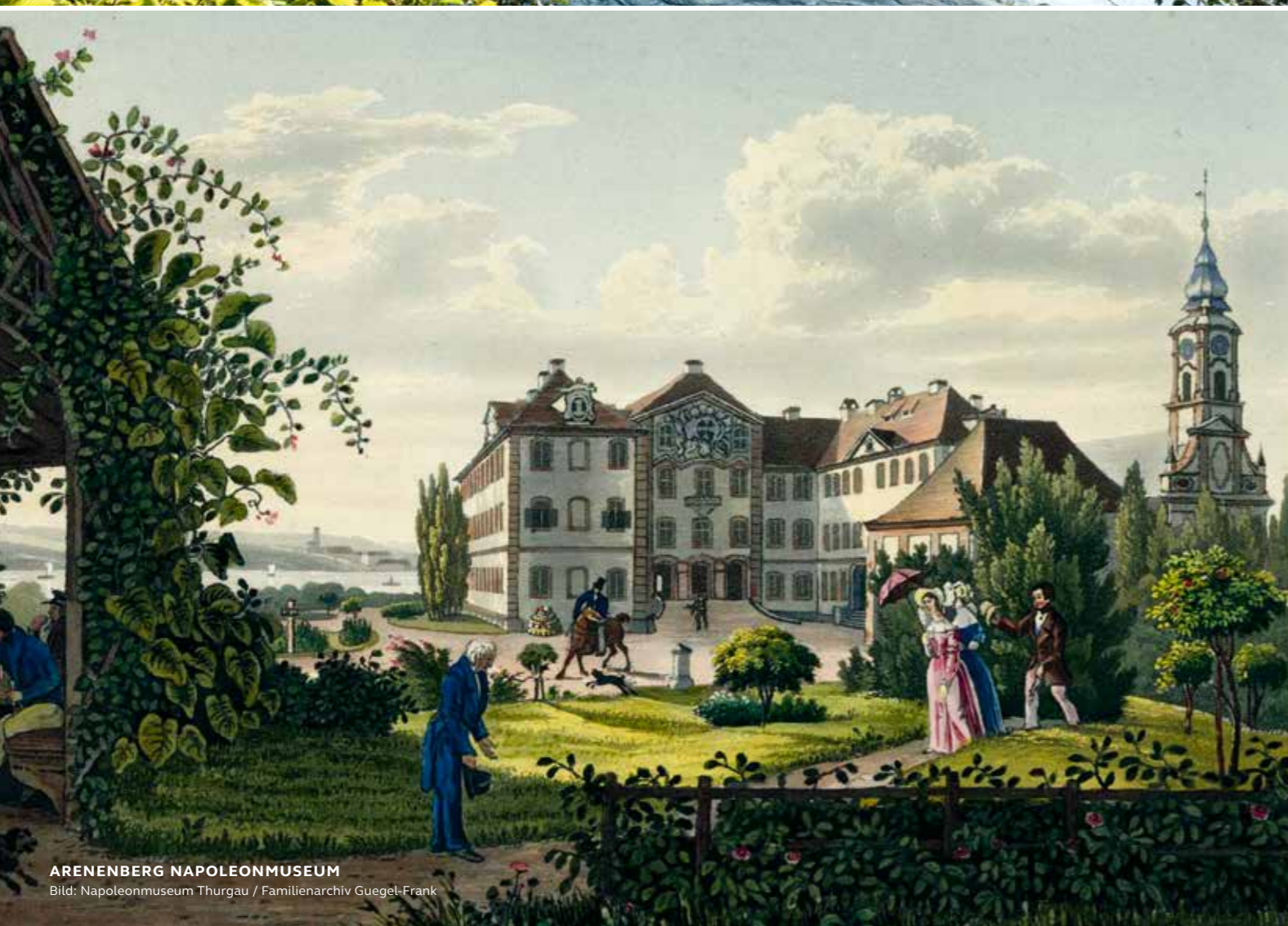
ARENENBERG NAPOLEONMUSEUM

Der Ausflug mit dem Bus ist eine ideale Alternative für Zeiten, in denen die Rheinschifffahrt eingestellt ist. Hierbei bietet sich ein Besuch des Schlosses Arenenberg an.