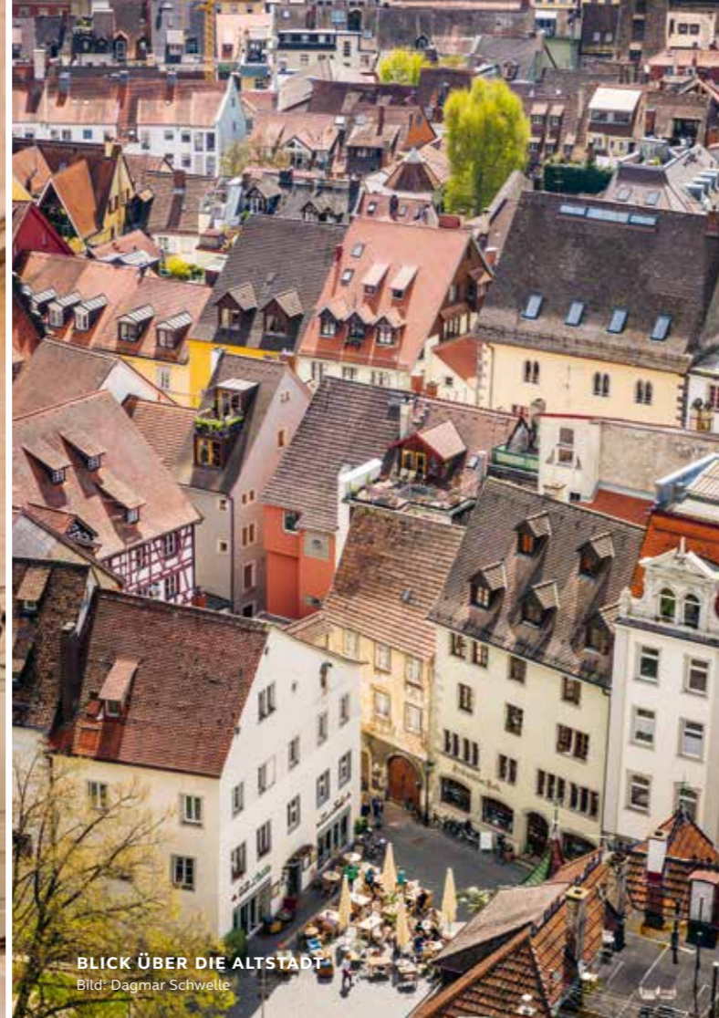
BLICK ÜBER DIE ALTSTADT