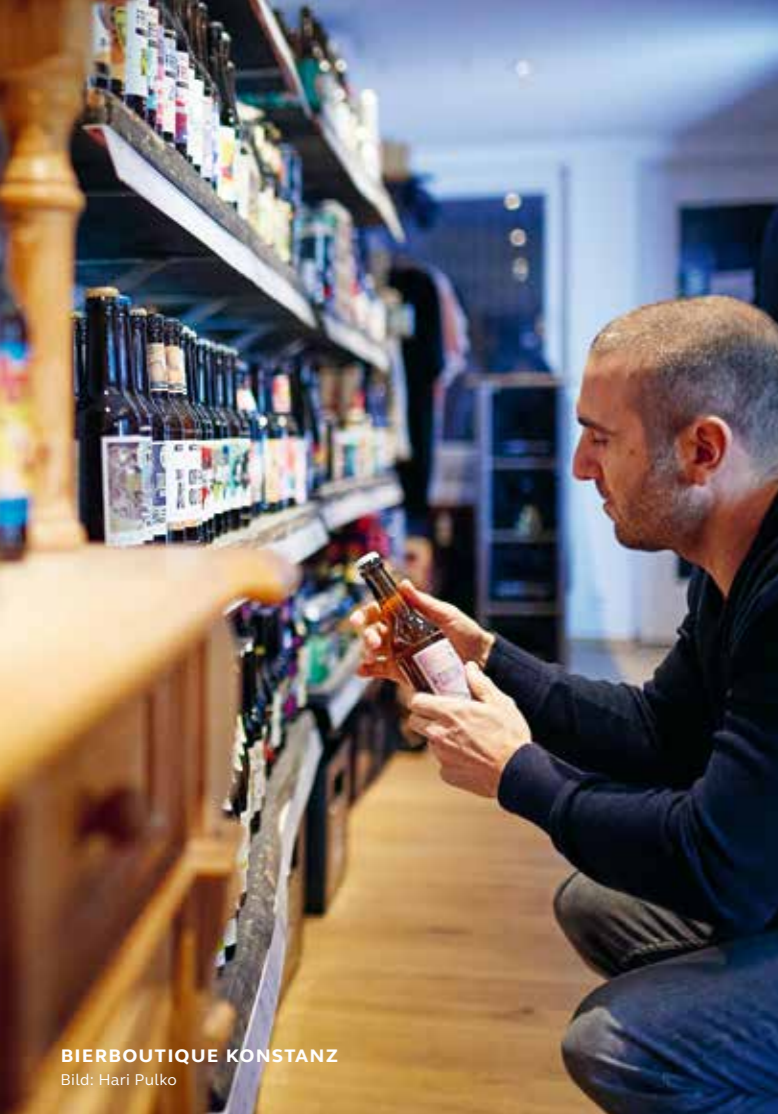
BIERBOUTIQUE KONSTANZ