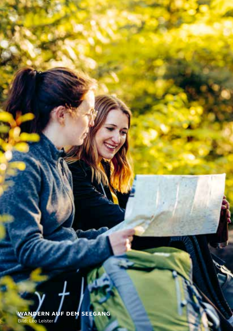
WANDERN AUF DEM SEEGANG