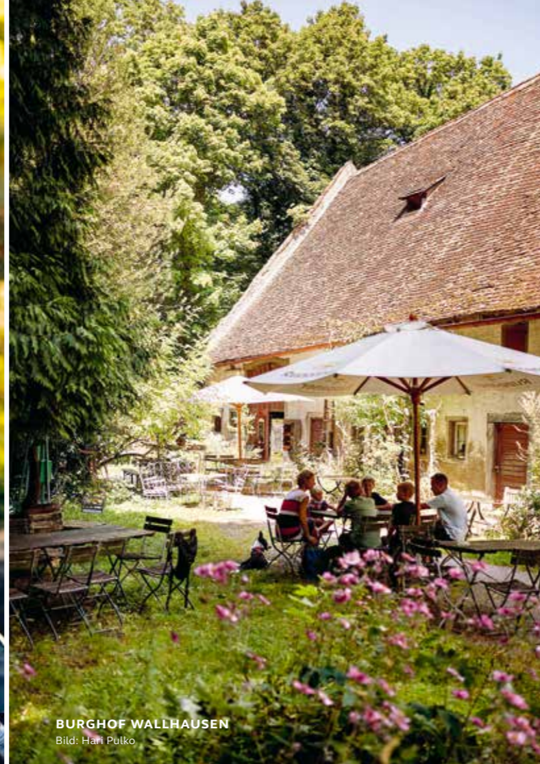
BURGHOF WALLHAUSEN