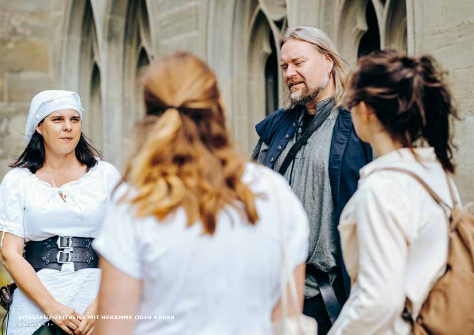
KONSTANZ-ZEITREISE MIT HEBAMME ODER BADER