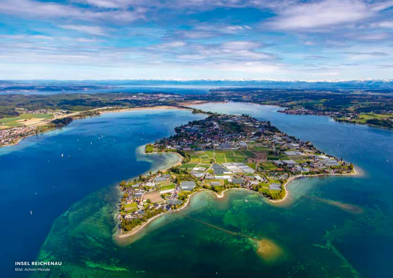
INSEL REICHENAU