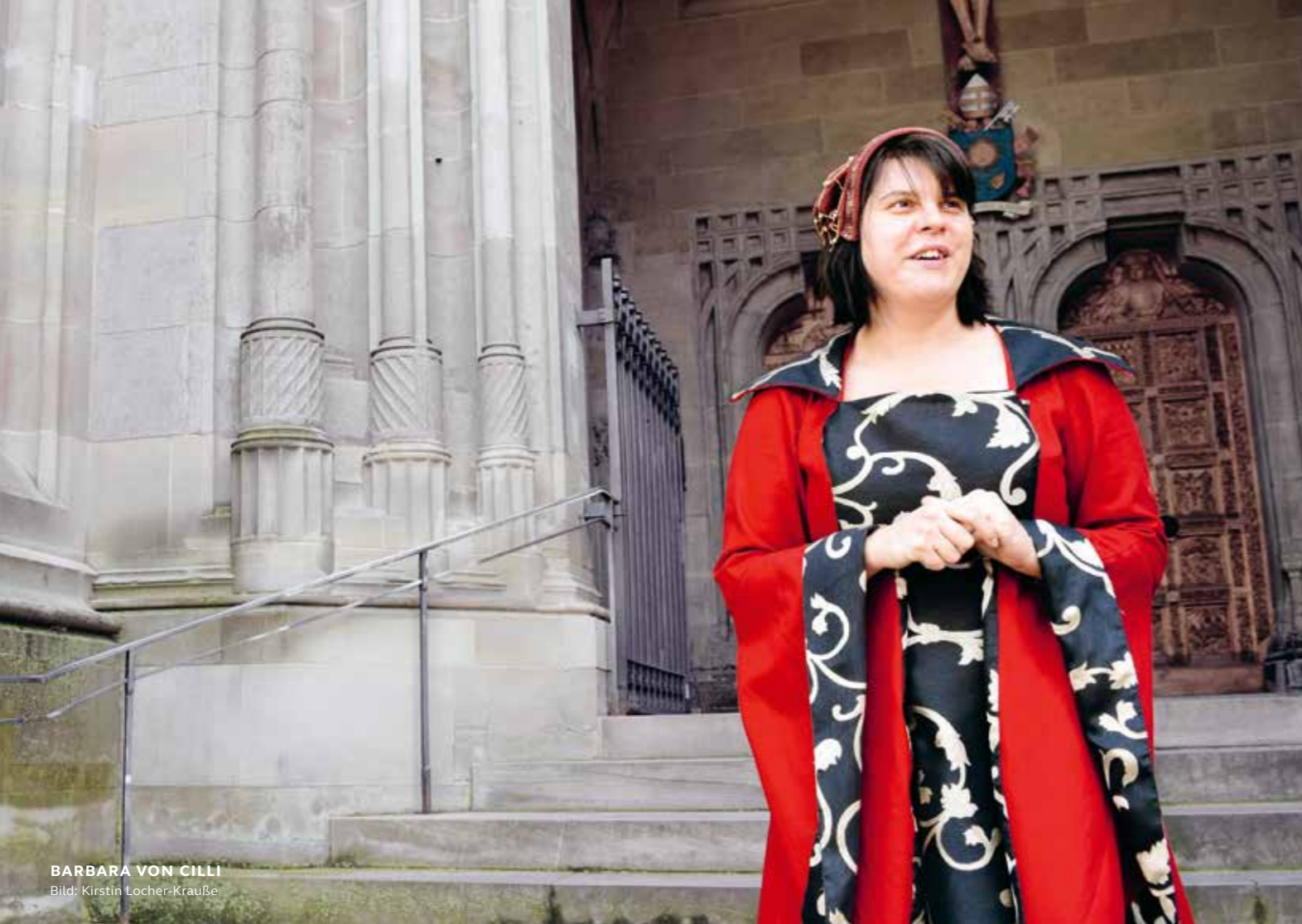
BARBARA VON CILLI