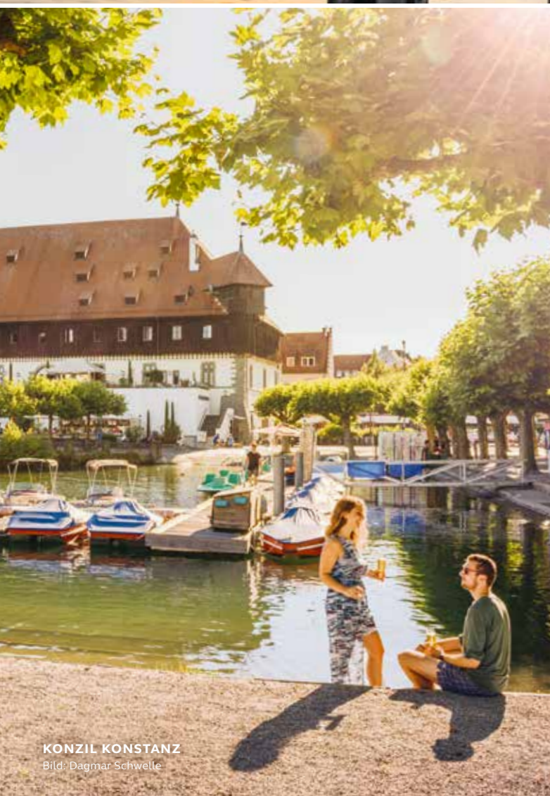
KONZIL KONSTANZ