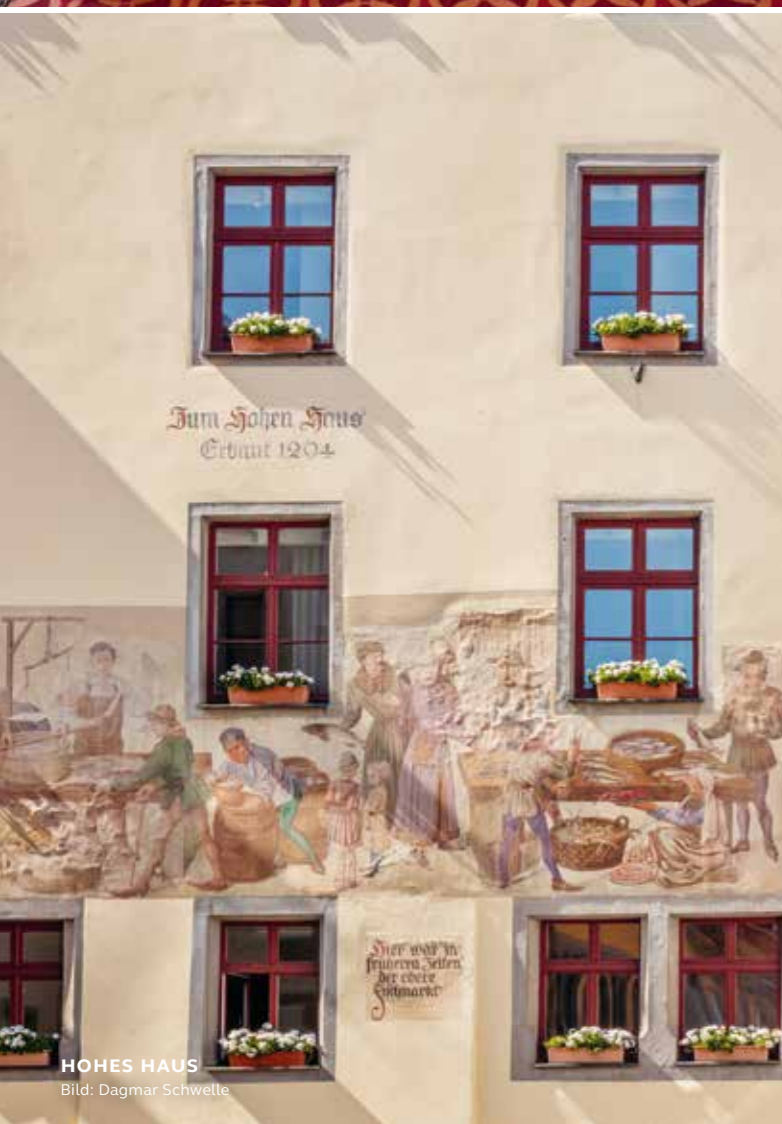
HOHES HAUS